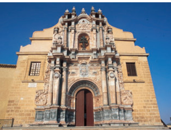
Santuario de la Santísima y Vera Cruz.

La cultura murciana también se reforzó en el siglo XVII, los estudios de carácter superior tuvieron un gran desarrollo. A los colegios de franciscanos y dominicos, se les unieron los de los jesuitas.